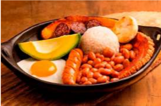
庶民盤餐 Bandeja paisa

Bandeja paisa (庶民盤餐)使用多道傳統食材烹製，玉米餅 ( Arepa ) 是餅皮酥脆、內層鬆軟的平民美食。帶您一嚐 La lechona 經典肉類菜餚、炸大蕉 Patacones 跟受歡迎的 AJIACO 高湯，品味傳統飲料 El Agua de La Panela (紅糖茶)、清爽酒精飲品 Refajo 及國酒 Aguardiente。