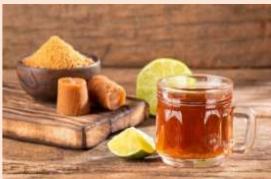
紅糖茶 El Agua de La Panela