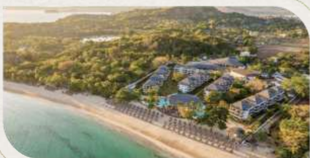
北方諾西貝 | 連泊3晚 Hotel The Royal Andilana Resort & Spa