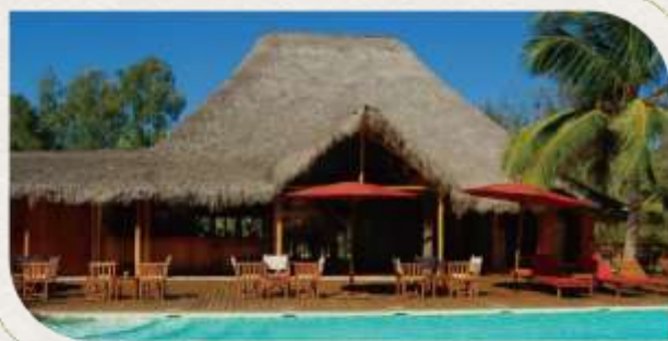
Palissandre | 連泊2晚 Cote Ouest resort & SPA 穆隆達瓦唯一的 4 星級飯店，坐落在海邊的 休閒渡假中心，結合當地悠閒氛圍，打造出 獨一無二的華麗感。