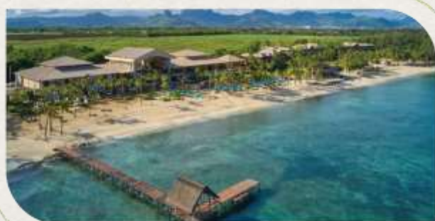
Le Meridien Maurice | 連泊2晚 艾美酒店坐落在長達1公里長的象牙色的沙 灘旁，以熱帶島嶼風情為背景的艾美酒店， 將帶您走入模里西斯的繽紛裡，感受浪漫的 本質！