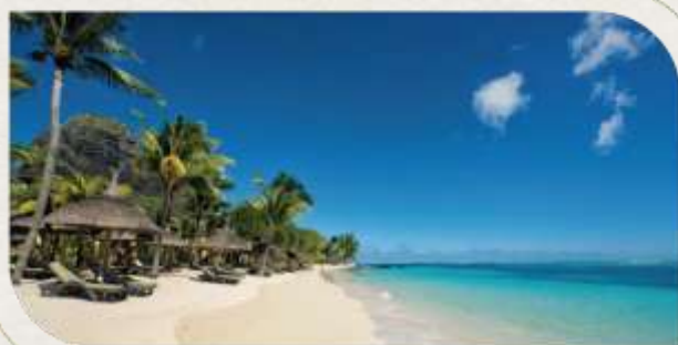
Le Paradis Beachcomber | 連泊2晚 Le Paradis 坐落於世界遺產 莫恩山下，壯 闊山景作為背景，眼前則是 全島最美、最細 緻、最純淨的沙灘，長達數公里的白沙與碧 藍潟湖在此相遇，形成無法複製的夢幻海岸 線。