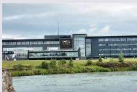
塞爾福斯 Hótel Selfoss